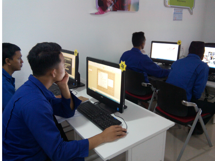
Para pelajar membuat aktiviti 'hands-on' MS PowerPoint (kumpulan A)