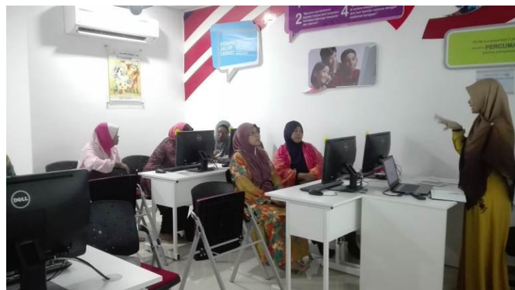
Komuniti berkongsi maklumat dan permasalahan yang berlaku kepada penceramah