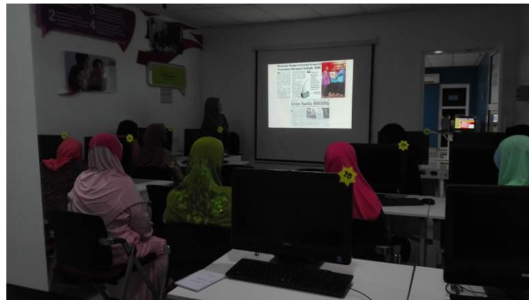
Memberi maklumat yang sesuai untuk membuat tuntutan faraid.(contoh gambar kesan buruk tidak memandangi kepentingan faraid dalam islam)