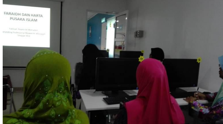
Pengenalan “ faraid dan harta pusaka islam”